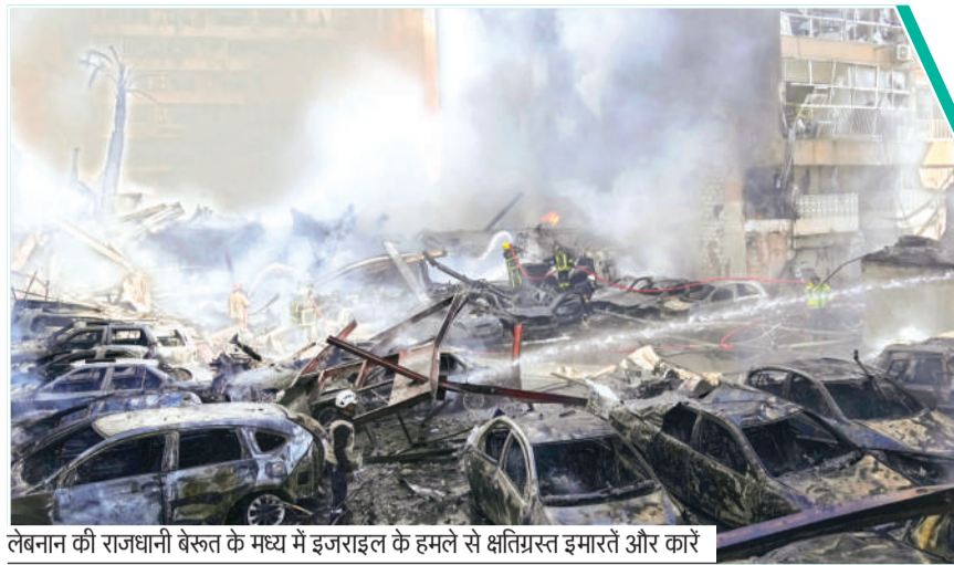
लेबनान की राजधानी बरूत के मध्य में इजराइल के हमले से क्षतिग्रस्त इमारतें और कारें