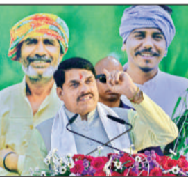
हरिभूमि न्यूज ▶▶ जबलपुर

मुख्यमंत्री डॉ. मोहन यादव ने कहा कि मध्यप्रदेश कृषि, परंपरा और आधुनिक तकनीक के समन्वय से देश में कृषि विकास का अग्रणी राज्य बनकर उभरा है। किसानों की मेहनत, वैज्ञानिकों के शोध और सरकार की योजनाओं के प्रभावी क्रियान्वयन से प्रदेश ने उत्पादन के नए आयाम स्थापित किए हैं। उन्होंने कहा कि समृद्ध किसान-समृद्ध मप्र की थीम के साथ पूरे वर्ष प्रदेश में कृषि उत्सव मनाया जा रहा है। मुख्यमंत्री डॉ. यादव बुधवार को जवाहरलाल नेहरू कृषि विश्व विद्यालय, जबलपुर में आयोजित 'कृषि' ▶ शोष पेज 4 पर