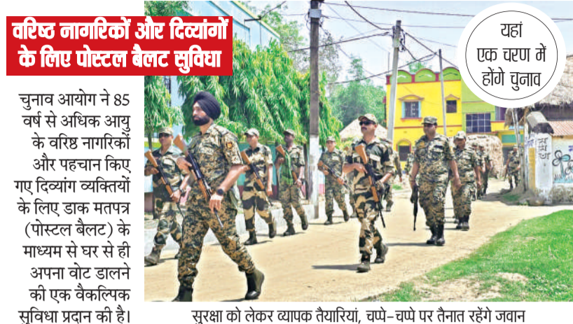
यहां एक चरण में होगा चुनाव