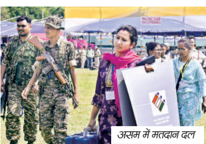
असम में मतदान दल

असम, केरल और केंद्र शासित प्रदेश पुडुचेरी में विधानसभा चुनाव के लिए प्रचार का शोर अब पूर्ण रूप से थम चुका है। गुरुवार को इन तीनों क्षेत्रों को कुल 296 सीटों पर एक ही चरण में मतदान होने हैं। इसके साथ ही उम्मीदवारों की किस्मत ईवीएम में कैद हो जाएगी। चुनाव आयोग के अनुसार, असम की 126, केरल की 140 और पुडुचेरी की 30 सीटों पर वोटिंग कराई जाएगी। असम की बात करें तो यहां कुल 2.5 करोड़ मतदाता हैं, जिनमें 1.25 करोड़ पुरुष, 1.25 करोड़ महिलाएं और 343 थर्ड जेंडर मतदाता शामिल हैं। खास बात यह है कि 18-19 वर्ष आयु वर्ग के