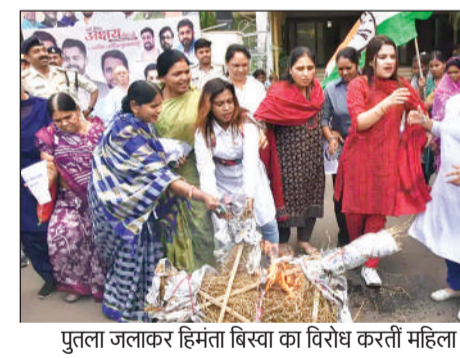
पुतला जलाकर हिमंता बिस्वा का विरोध करती महिला कांग्रेस।

उन्होंने एक दलित वर्ग के नेता, कांग्रेस पार्टी के राष्ट्रीय अध्यक्ष मल्लिकार्जुन खरगे का अपमान किया है। आज हमने असम के मुख्यमंत्री हिमंता बिस्वा सरमा का पुतला जलाया है। अगर वे माफी नहीं मांगते हैं तो महिला कांग्रेस आगे भी उनके खिलाफ विरोध प्रदर्शन करती रहेगी।