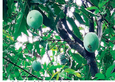
आम के पेड़ में पहले ऐसे लगे थे बड़े-बड़े आम।

इसका वीडियो भी सोशल मीडिया पर हो रहा खूब वायरल, जिनकी डंगाल काट कर नीचे गिरा दी है