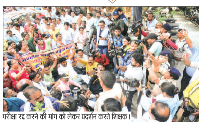
परीक्षा रद्द करने की मांग को लेकर प्रदर्शन करते शिक्षक।