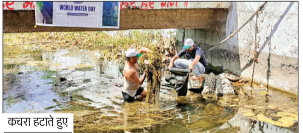
कचरा हटाते हुए

विश्व जल दिवस 2026 के अवसर पर रिलायंस फाउंडेशन द्वारा शुरू किया गया 'वाटर फॉर लाइफ' अभियान अब एक बड़े जन-आंदोलन का रूप ले रहा है। इस पहल के अंतर्गत मात्र 10 दिनों में मध्यप्रदेश और छत्तीसगढ़ के 15 जिलों में स्वयंसेवकों ने एकजुट होकर 153 से अधिक जल स्रोतों की सफाई की।