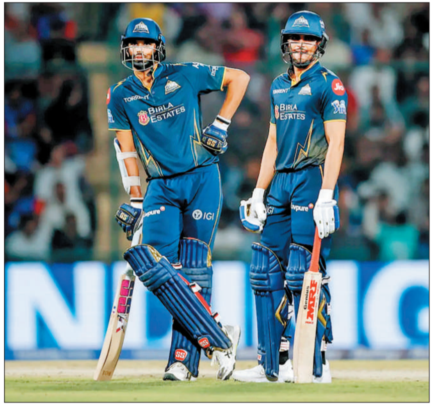
टी20 में बटलर के 600 छक्के पूरे जोस बटलर ने अरुण जेटली स्टेडियम में पांच छक्के लगाए। इसके साथ ही उन्होंने टी20 क्रिकेट में 600 छक्के पूरे कर लिए। इस मैच से पहले उनके 595 छक्के थे। टी20 में सबसे ज्यादा छक्के लगाने वाले बल्लेबाजों में कैरेबियाई खिलाड़ियों का दबदबा है। क्रिस गेल शीर्ष पर हैं। क्रोरेन पोलाई दूसरे, आंद्रे रसेल तीसरे और निकोलस पूरन चौथे नंबर पर हैं। बटलर पांचवें नंबर पर हैं।