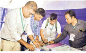
एजेसी न्यूहावाटी / नई दिल्ली

असम, केरल और केंद्र शासित प्रदेश पुदुचेरी में विधानसभा चुनाव के लिए गुरुवार को एक ही चरण में मतदान कराया जाएगा। चुनाव आयोग और स्थानीय प्रशासन ने शांतिपूर्ण, निष्पक्ष और पारदर्शी मतदान सुनिश्चित करने के लिए व्यापक तैयारियां पूरी कर ली हैं। असम विधानसभा चुनाव को लेकर सुरक्षा व्यवस्था कड़ी कर दी गई है। चिरांग जिले में शांतिपूर्ण और सुरक्षित ढंग से मतदान कराने के लिए सुरक्षा व्यवस्था को लेकर व्यापक तैयारियों की गई हैं। केंद्रीय औद्योगिक सुरक्षा बल की इकाई, तेल निगम के बॉगाईगांव केंद्र, केंद्रीय रिजर्व पुलिस बल, जिला प्रशासन और राज्य पुलिस के वरिष्ठ अधिकारियों ने मिलकर तय किए गए कक्ष के स्थान का निरीक्षण किया। इस दौरान व्यवस्था और आवश्यक सुरक्षा ढांचे का गहन समीक्षा की गई। अधिकारियों ने निरीक्षण के दौरान यह सुनिश्चित करने पर जोर दिया कि मजबूत कक्ष के आसपास सुरक्षा के सभी जरूरी प्रबंध समय से पहले पूरे कर लिए जाएं। अधिकारियों का कहना है कि चुनाव के दौरान मतपेटियों और संबंधित सामग्री की सुरक्षा सर्वोच्च प्राथमिकता होती है। किसी भी तरह की लापरवाही की कोई गुंजाइश नहीं रहेगी।