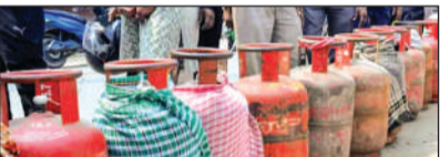
लगातार निगरानी और तालमेल रूप से चल रहा कामकाज

एजेसी नई दिल्ली दुनिया भर में ऊर्जा के संकट के बीच ईंधन की उपलब्धता बाधित हुई है और कई क्षेत्रों में ईंधन की कमी आ गई है। इस बीच भारत ने अपने घरों के लिए एलपीजी की सुलभता को जारी रखा है और बाहरी चुनौतीपूर्ण परिस्थितियों के बावजूद बड़े पैमाने पर स्थिरता को सुनिश्चित किया है। भारत अपनी एलपीजी की 60 फीसदी जरूरत के लिए आयात पर निर्भर है और स्ट्रेट ऑफ होमरुज के जरिए वैश्विक आपूर्ति के केंद्रीकरण को देखते हुए, सरकार ने आपूर्ति सुरक्षित करने और घरेलू उपलब्धता बढ़ाने के लिए तेजी से कदम उठाए। घरेलू उत्पादन बढ़ाने और कई भौगोलिक क्षेत्रों से सोर्सिंग में विविधता लाने जैसे उपायों ने सुनिश्चित किया कि आपूर्ति स्थिरता से होती रही। यही कारण है पूरे देश में एलपीजी का वितरण बड़े पैमाने पर जारी है। 1 मार्च 2026 से अब तक 18 करोड़ से ज्यादा सिलेंडर डिलीवर किए जा चुके हैं और रोजाना 60 लाख से ज्यादा सिलेंडरों की आपूर्ति की जा रही है। डिलीवरी का औसत समय लगभग तीन दिन बना हुआ है।