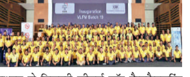
माध्यम से विजनी लीडर्स फॉर मैयूकेचरिंग (वीएलएफएम) सीनियर मैनेजर्स प्रोग्राम के 19वें बैच का उद्घाटन किया।

प्रधानमंत्री नरेंद्र मोदी के मेक इन इंडिया जैसी पहलों के माध्यम से भारत को वैश्विक विनिर्माण शक्ति में बदलने के दृष्टिकोण के अनुरूप, औद्योगिक क्षमता, नवाचार और कौशल विकास को मजबूत करने पर ध्यान केंद्रित किया जा रहा है। विनिर्माण जीडीपी वृद्धि, रोजगार सृजन और वैश्विक प्रतिस्पर्धा का एक प्रमुख चालक बना हुआ है। इस दृष्टिकोण को सुदृढ़ करते हुए भारतीय उद्योग परिसंघ (सीआईआई) ने सीआईआई नौरोजी गोदरेज विनिर्माण उत्कृष्टता केंद्र के