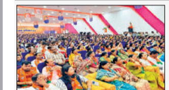
मुख्यमंत्री डॉ. यादव ने कहा कि कांग्रेस की अपनी स्वयं की कोई विचारधारा नहीं है। कांग्रेस पार्टी के कुछ नेताओं के व्यक्तिगत हितों के कारण केसर की ब्यारी वाली धरती जम्मू-कश्मीर में हजारों निर्दोष लोगों का खून बहाया गया। डॉ. श्यामा प्रसाद मुखर्जी ने जम्मू-कश्मीर में दो दिवधान, दो प्रधान और दो निशान का विरोध करते हुए आंदोलन किया और जनसंघ की स्थापना की।

सरकार के कार्यों को जनता तक पहुंचाएं संगठन को मजबूत बनाएं: मंत्री सिंह मंत्री राकेश सिंह ने कहा कि भाजपा कार्यकर्ता आधारित दल है। कार्यकर्ताओं की बदलेत भाजपा आज विश्व का सबसे बड़ा राजनीतिक दल बना है। मप्र सरकार की उपलब्धियां जनता को बताएं कि कैसे जनता जगद्विन के हितों के लिए भाजपा संगठन और सरकार प्रतिबद्ध है।