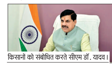
किसानों को संबोधित करते सीएम डॉ. यादव।

मुख्यमंत्री डॉ. मोहन यादव ने कहा कि प्रदेश में 9 अप्रैल से गेहूं खरीदी शुरू हो रही है। उन्होंने सभी उपाजर्न केंद्रों पर किसानों के लिए सहज-सुगम व्यवस्था सुनिश्चित करने के निर्देश सभी कलेक्टर और एसडीएम को दिए हैं। उन्होंने कहा कि उपाजर्न केंद्रों पर किसानों के लिए पेयजल और छायादार स्थान की व्यवस्था की जा रही है। गेहूं उपाजर्न जैसी महत्वपूर्ण और व्यापक गतिविधि में सामाजिक और सेवाभावी संस्थाएं भी सहयोग करें। प्रदेश में वर्ष 2026 को किसान कल्याण वर्ष के रूप में मनाया जा रहा है। मुख्यमंत्री डॉ. यादव ने यह विचार किसान और