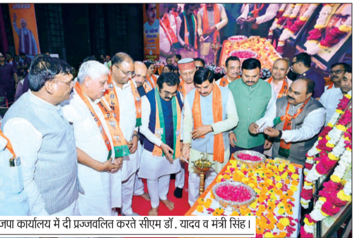
भाजपा कार्यालय में दी प्रज्वलित करते सीएम डॉ. यादव व मंत्री सिंह।