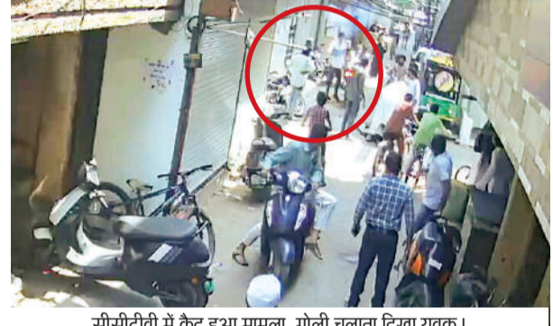
सीसीटीवी में कैद हुआ मामला, गोली चलाने दिखा युवक।

पुलिस प्रकरण दर्ज कर आरोपी की गिरफ्तारी के कर रही प्रयास