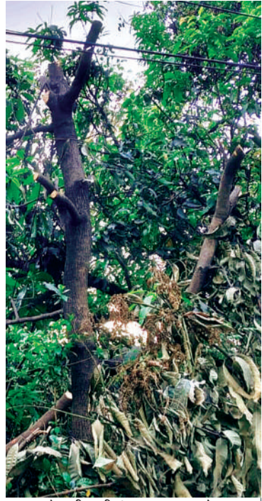
फलदार पेड़ की सारी डगाल काट कर छोड़ा।