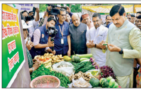
प्रदर्शनी का अवलोकन करते सीएम

उन्होंने कहा कि नर्मदा घाटी परियोजनाओं और सिंचाई विस्तार से प्रदेश की कृषि उत्पादन क्षमता में उल्लेखनीय वृद्धि हुई है। इस अवसर पर उन्होंने उन्नत बीज प्रसंस्करण,