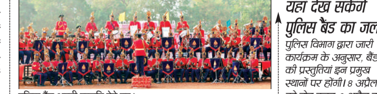
पुलिस बैंड अपनी प्रस्तुति देते हुए।

उल्लेखनीय है कि मध्यप्रदेश पुलिस द्वारा आरक्षक (बैंड) के कुल 679 पदों पर सीधी भर्ती के लिए आवेदन आमंत्रित किए गए हैं। यह भर्ती प्रक्रिया विशेष रूप से पुरुष अर्थात् युवाओं के लिए है। इच्छुक और पात्र उम्मीदवार एमपी ऑनलाइन के पोर्टल के माध्यम से 19 अप्रैल 2026 तक अपने आवेदन जमा कर सकते हैं। आवेदन प्रक्रिया 5 अप्रैल से शुरू हो चुकी है। मध्यप्रदेश पुलिस ने प्रदेश के प्रतिभाशाली युवाओं से अपील की है कि वे इस स्वर्णिम अवसर का लाभ उठाएं। पुलिस बैंड का हिस्सा बनकर युवा न केवल अपनी कला को प्रदर्शित कर सकेंगे, बल्कि अनुभूतिपूर्ण पुलिस बल में शामिल होकर राष्ट्र निर्माण में अपना महत्वपूर्ण योगदान भी दे सकेंगे।