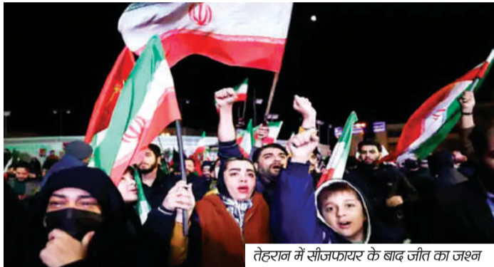
तेहरान में सीजफायर के बाद जीत का जश्न

डोनाल्ड ट्रंप की 5 वीं घंटी के बाद ईरान से जंग 2 हफ्तों के लिए रुक गई। दोनों देश 2 हफ्तों के सीजफायर के लिए राजी हो गए हैं। ट्रंप ने यह युद्ध-विराम अपने सोशल मीडिया प्लेटफॉर्म ट्विटर पर घोषित किया। उन्होंने कहा कि पाकिस्तान की तरफ से दिया गया प्रस्ताव स्वीकार कर लिया है। इस प्रस्ताव में कहा गया है कि दो हफ्तों तक लड़ाई रोक दी जाए और होर्मुज जलडमरूमध्य को तुरंत खोल दिया जाए। ट्रंप ने कहा कि अमेरिका इन दो हफ्तों के समय का इस्तेमाल ईरान के साथ अंतिम समझौता करने के लिए करेगा। उन्होंने लिखा कि ऐसा करने का कारण यह है कि हम अपने सभी सैन्य लक्ष्यों को पहले ही पूरा कर चुके हैं और उनसे भी आगे बढ़ चुके हैं। साथ ही हम ईरान के साथ लंबे समय की शांति और पूरे मध्य पूर्व में शांति के लिए एक पक्का समझौता करने के बहुत करीब हैं। ट्रंप ने यह भी कहा कि ▶ शोष पेज 4 पर