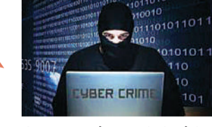
मोबाइल पर पैस कटने के मैसेज आए। फरियादी ने घटना की शिकायत साइबर सेल में की थी।

अशोका गार्डन थाना क्षेत्र स्थित पंजाबी बाग में रहने वाले एक युवक से साइबर जालसाज ने 1 लाख 38 हजार रुपए की चपत लगा दी। आरोपी ने युवक के बैंक अकाउंट के नंबर के आधार पर फर्जी क्रेडिट कार्ड बनाकर एक लाख 38 हजार की खरीददारी कर ली। खुलासा उस समय हुआ जब फरियादी के