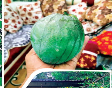
पेड़ की डगाल काटने के बाद पड़ी हुई।

थाना प्रभारी का तर्क- अधिकारियों को शिकायत की है