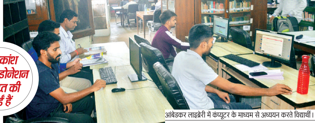
आंबेडकर लाइब्रेरी में कंप्यूटर के माध्यम से अध्ययन करते विद्यार्थी।